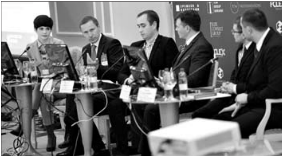
Из-за ситуации с массовой ликвидацией банков работник Фонда гарантирования вкладов физлиц оказался в центре внимания участников форума

с мошенничеством», — рекомендует юрист, подчеркивая, что такие действия могут дать положительный результат лишь в комплексе.