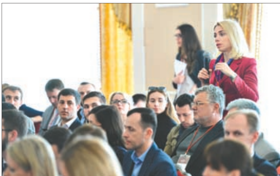
Каждый доклад сопровождался рядом вопросов, обсуждение которых зачастую перерастало в конструктивную дискуссию