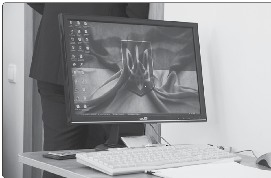
Проблеми з сервером НАЗК більше не повинні створювати ризику притягнення осіб до кримінальної відповідальності за неподання електронної декларації

Отже, навіть «кризи» в КСУ немає. Є лише бажання цю кризу змодельовати. І суттєво зіпсує репутацию суду. Зокрема, через відсутність аргументації у рішенні та ухвалення його кількома суддями за потенційного конфлікту інтересів. Як КСУ вийде з цієї ситуації і чи допоможе суду його раптова відкритість, стане відомо вже найближчим часом.